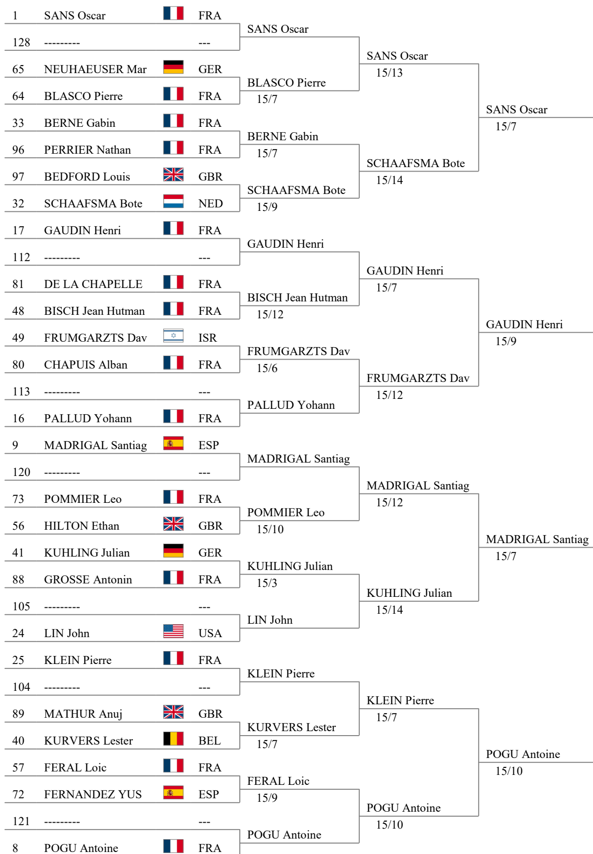
Tableau de 32