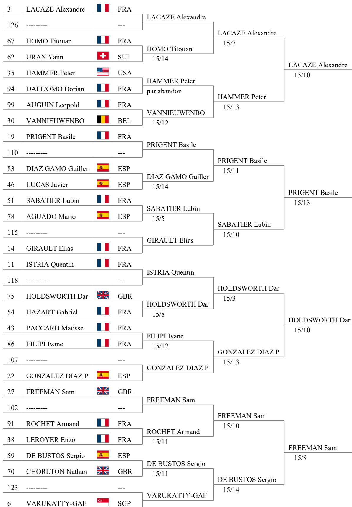
Tableau de 32